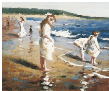
Joaquín Sorolla (1863 - 1923)